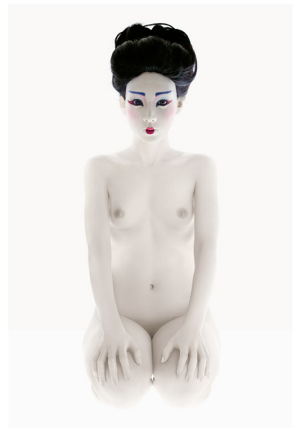
STILL LIFE #10

Il 18 settembre inaugura a Bologna la mostra fotografica Adoperabili-Usable di Gabriele Corni , ospitata dalla giovane galleria d'arte contemporanea Oltre Dimore. In questa prima tappa di una serie di appuntamenti in Italia ed Europa verranno presentate 16 opere fotografiche inedite e dal tema estremamente attuale.